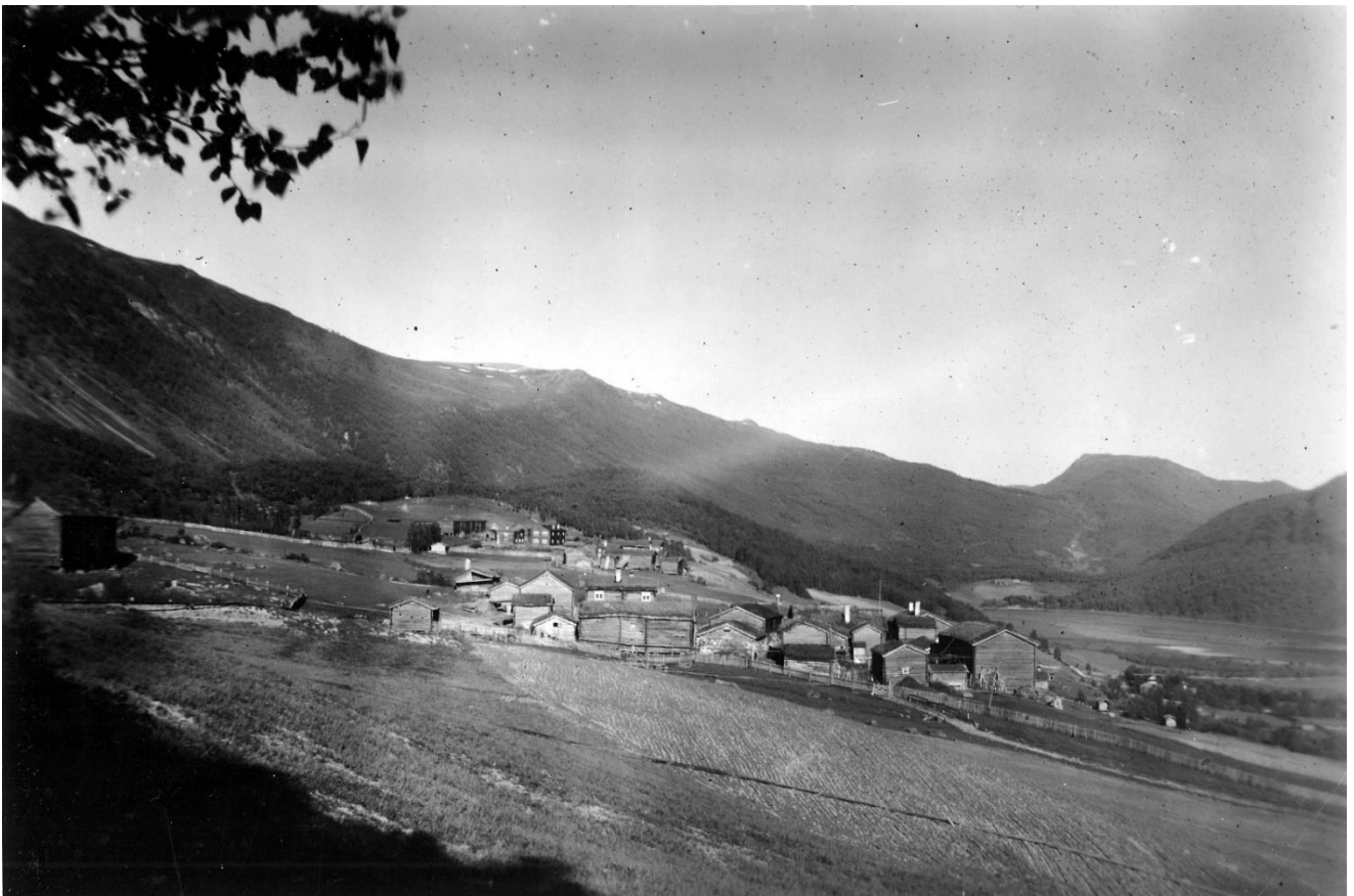
Sandbusgardane ca. 1900.