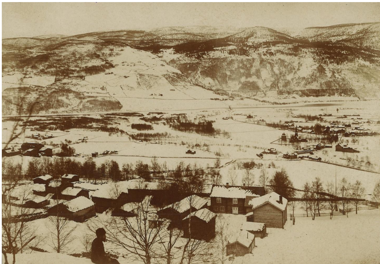
Sygard Blessom.