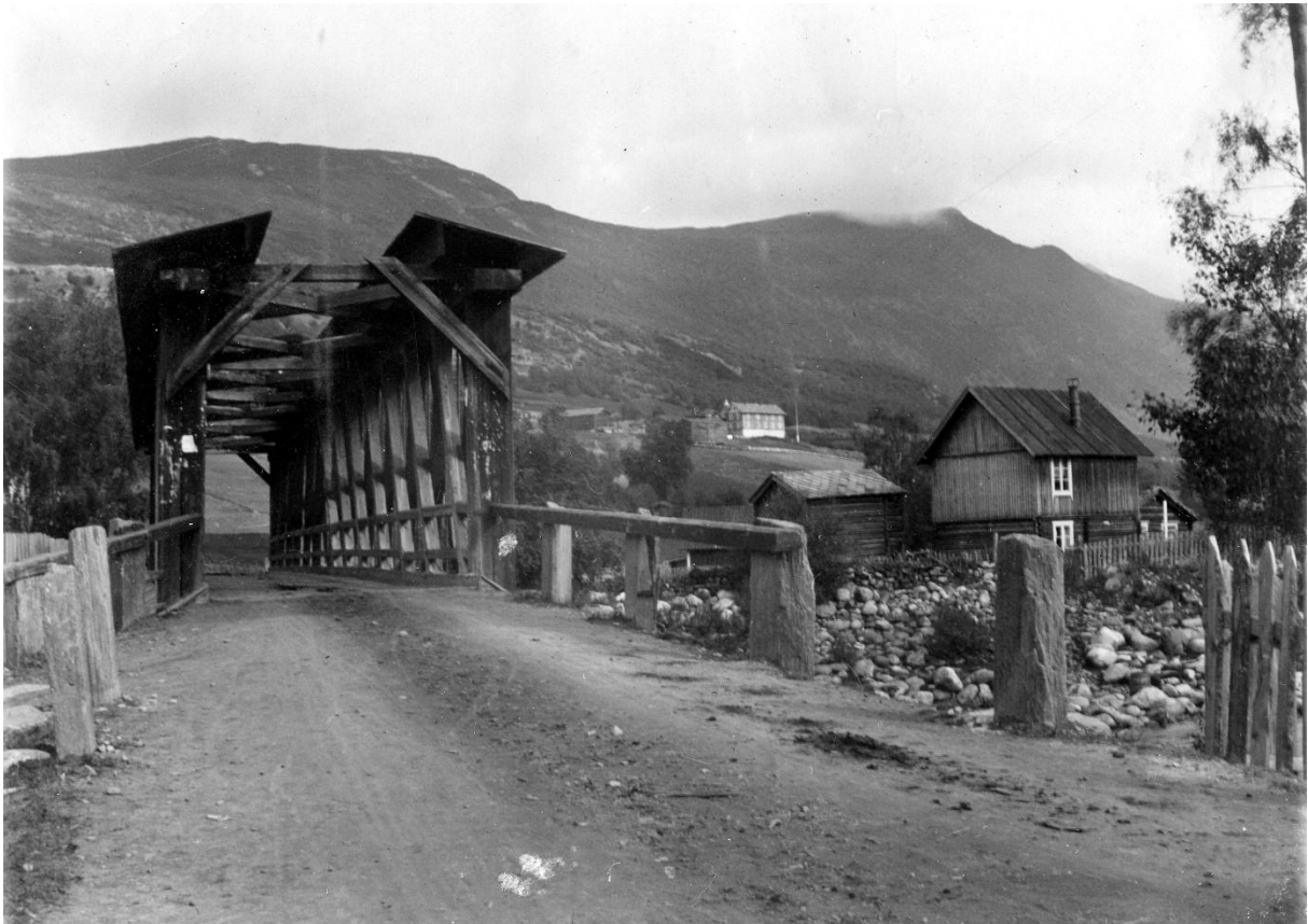
Finnbrua og søre Blessomøyen.