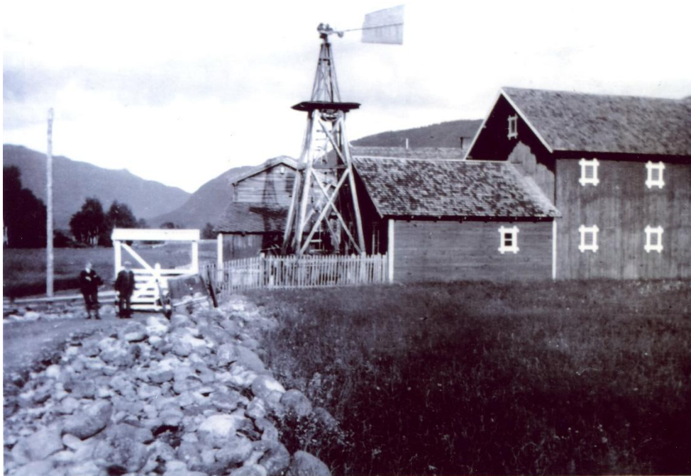
Volden / Stykket.