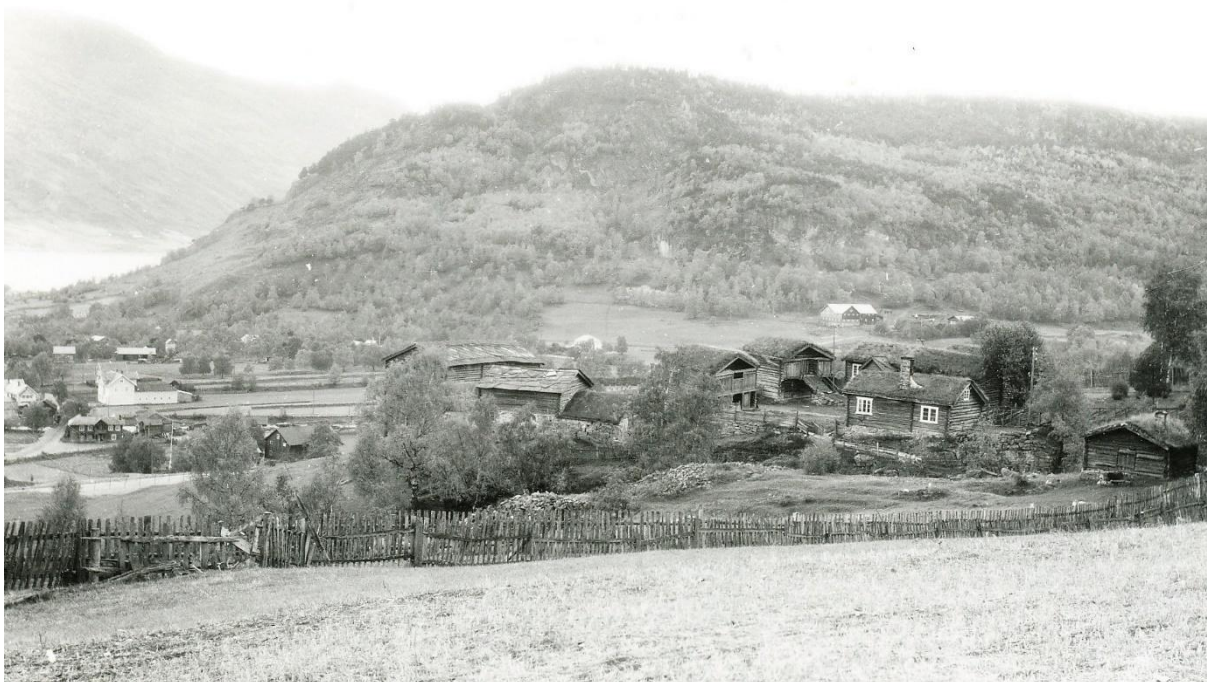
Haugøy.