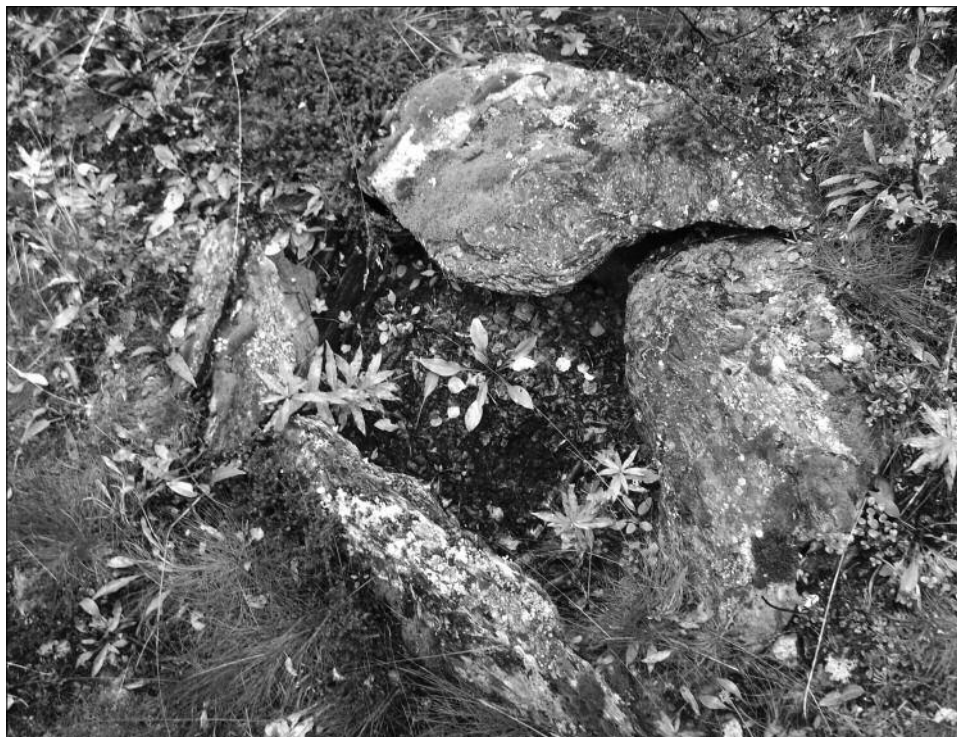
Mogleg reist av jernblester ved Hosketjønn.