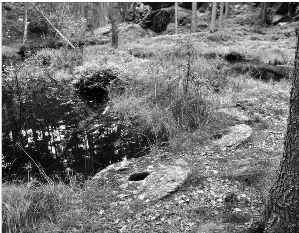
Fra Tolstadkvernberget.