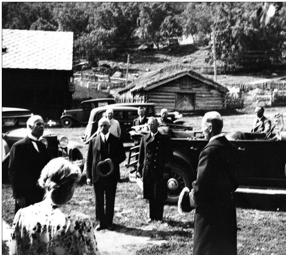
I Prestgarden. Frå kongebesøket i 1936.