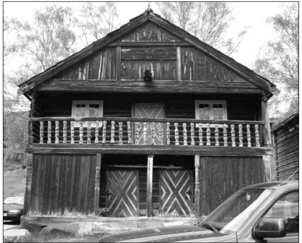
Stabbur på Håkenstad.