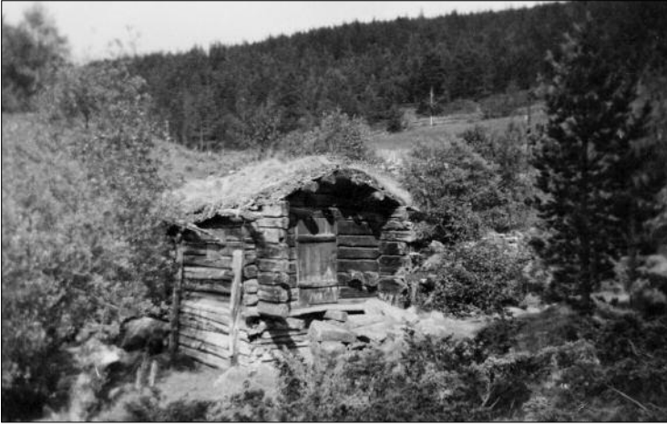
Kvernhus i Grova ved Maristugu i Synslien.

Var Tolstadkvernberget på noko tidspunkt den største industriverksemnda i Gudbrandsdalen? Masseproduksjon kan det ikkje ha vore. Under Gudbrandsdalsseminaret i 2010 på Maihaugen peikte ein av arkeologane i fylket på Oppland som eit viktig industrielt område i jernalder og mellomalder. Jern, fangst, klebergryter og døypefontar er nokre stikkord frå distriktet vårt. På 1600-talet kom koparverket i Sel og jernverket i Lesja. Kleberomnar vart leverte heilt til København. Nivået i skiferproduksjonen ser vi den dag i dag i kyrkjebolkane eller på den heildekte kyrkja i Dovre med skifer frå berget vi i dag kallar Pillarguri i Sel. Det er innanfor ei slik totalramme vi må sjå kvernberget på Lalm.