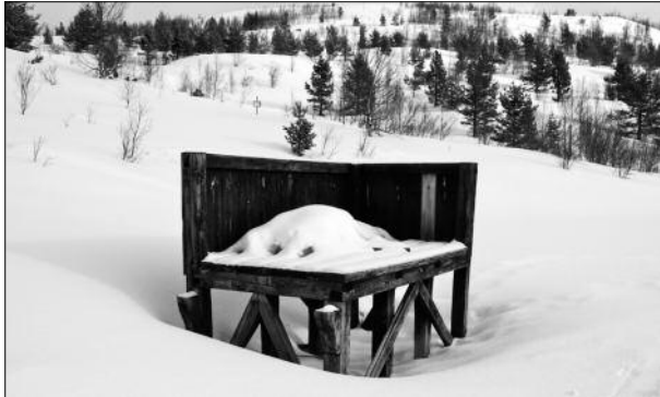
Rampa ved Klonessetra.

Hadde eg lagt vekt berre på mi subjektive vurdering, ville eg rangere denne turen som “turen over alle turar” i heimfjellet. Skituren “over åsane” har lange tradisjonar i Vågåbygda, både i skulesamanheng, og for private.