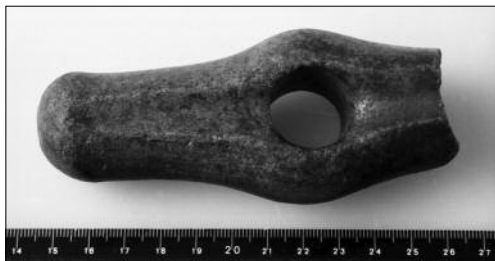
Stridsøksa fra Lien.

Den første befolkningen i Gudbrandsdalen var trolig jegernomader som fulgte etter reinen opp dalføret og over fjellet. Den eldste bosettingen i Oppdalsfjella er datert til omkring 6300 f.Kr. Med bakgrunn i klima- og vegetasjonshistoriske undersøkelser kan man se at det trolig har vært sammenhengende jordbruk i Vågå og omegn siden 2000 f.Kr.