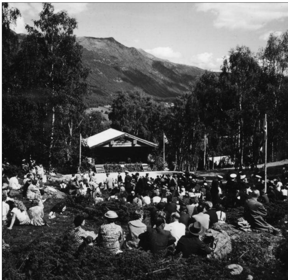
Frå stemne på utescena på 1960-talet.