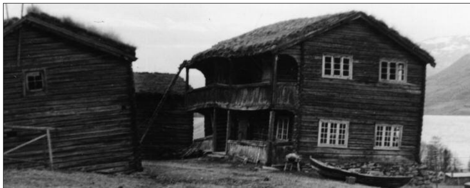
Stabburet og stugu på Sunde.