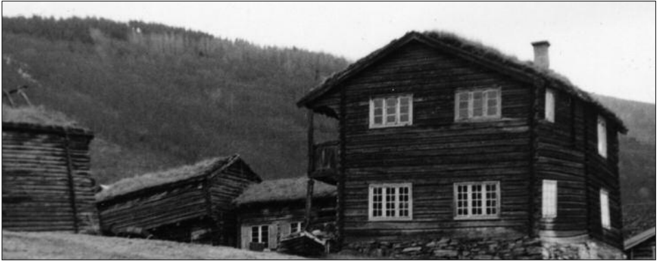
Sunde med stabbur og stall til venstre.

ha han Garde og Jord-Eigo, han sette burt; ut-paa Toten aatte han den store Garden Rognsta. Paa Sonde sette han upp ei trihøg Stugu og de va den Ti'e den einaste Stugo i heile Gullbrandsdale me tri Høgde, ho va no namnsport ou, ivi heile Dal'n.