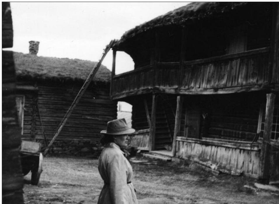
Sundstugu.