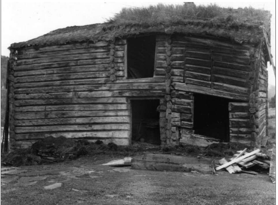
Øyastugu da ho vart rivi på Øy i 1957 eller 1958.