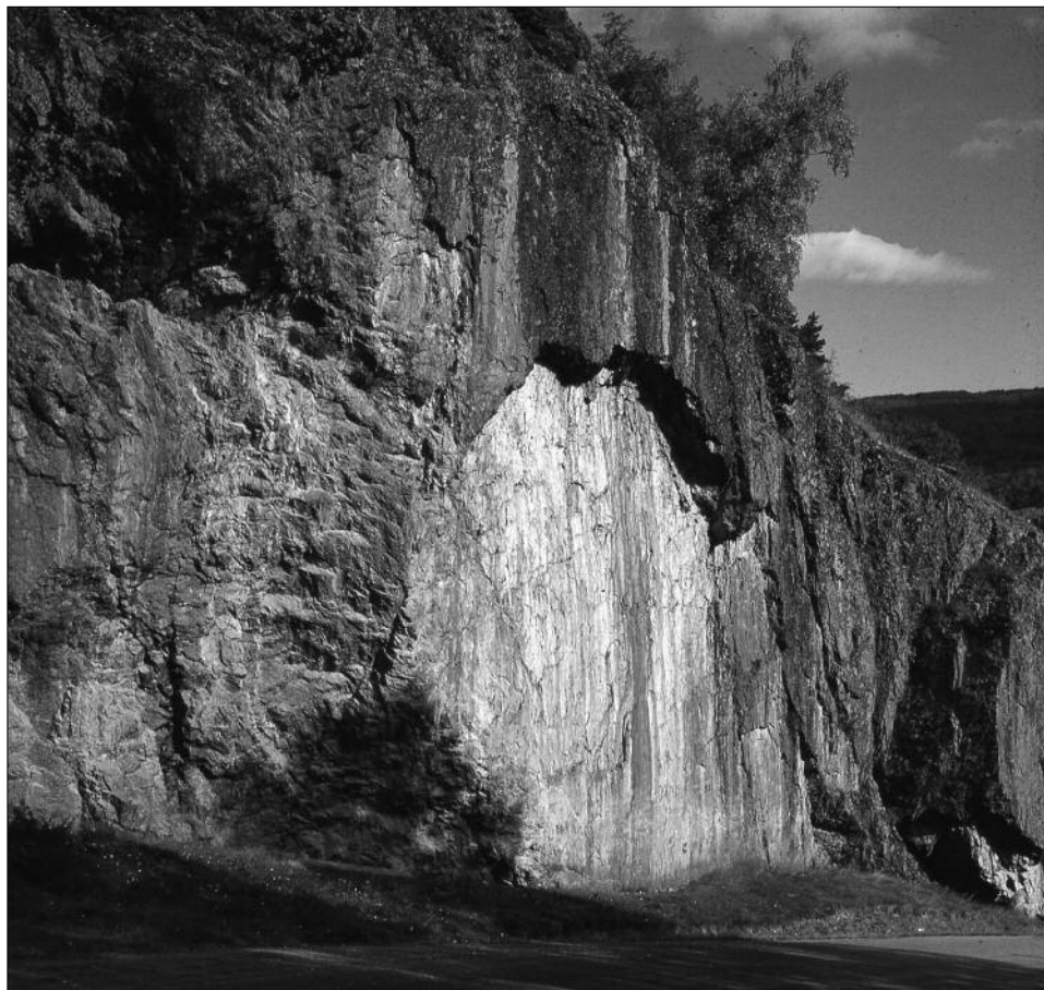
Jutulporten 1958.

Tæt uden og Vesten for Kirkegaarden, paa Vaage, staae 2de, nu smaae Bautasteine, men som uden Tvil have tilforn været meget høiere og større. I Kantene paa disse Steene har man dannet Huller, uden Tvil i de seenere Tiider, for deri at fastbinde Heste; og ved Siiden af dem staaer en stor rundaktig Kampesteen. Disse ere af de Steene, som man beretter, at bemeldte Jotul har kastet mod Kirken.