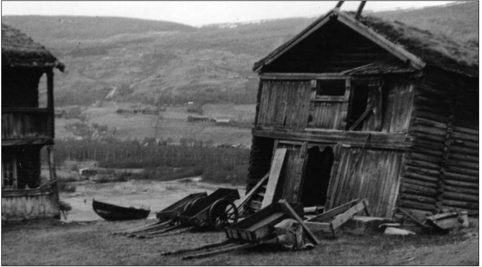
Sundstabburet slik det stod på Sunde.

000 Krono i vore Pening og me Pening-Verdaagaa som no er. Baade han Hendrik Sonde og Fruga laag salva onde Kjørkje-Golve i Vaagaa-Kjorkjun. Fruga laag me eit Baan i kaar Arm og Kjista va saa brei, at døm lout skjera utu for henne i eine Døra-Skjiun i Kjørkje-Dør'n førr døm fekk ho inn.