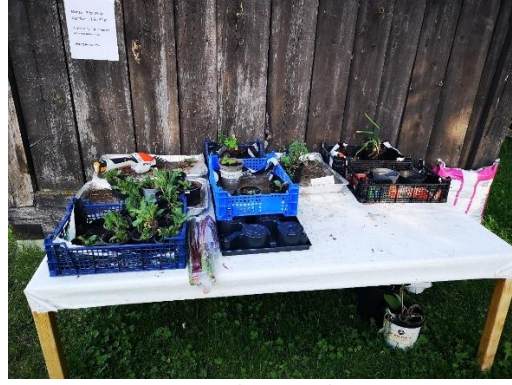
Figur 6 Avleggjarsal i juni