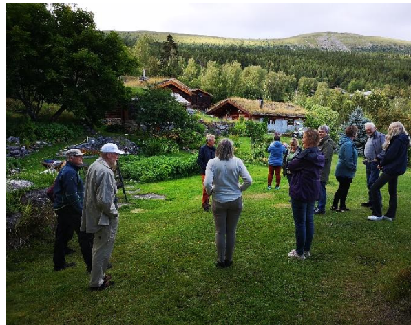
Figur 4 Bilde frå tur til Haukdalen