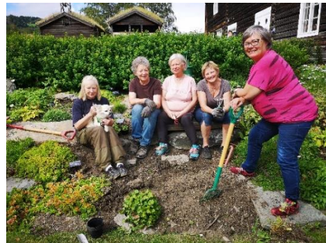
Figur 10 Live si gruppe i sving 5. august