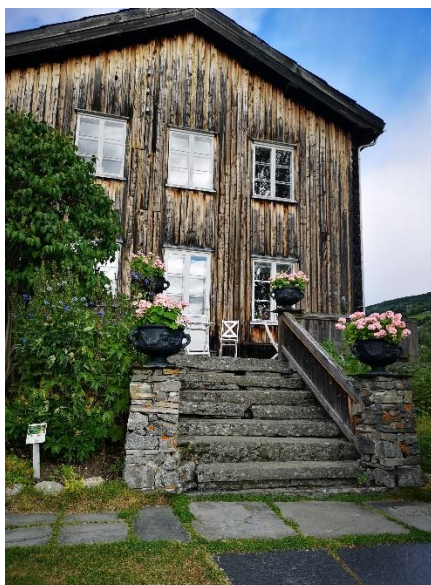
Figur 1 Dronning Ingrid pyntar opp verandaen