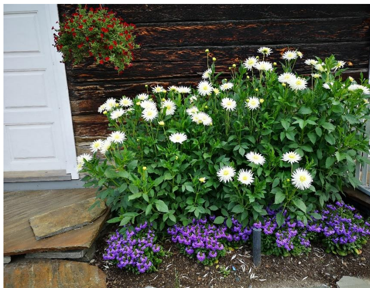
Figur 2 Kvite georginer m.m. ved hovudinngangen

Prestgardshågein er eigd av Vågå historielag, men er drifta som ei underavdeling.