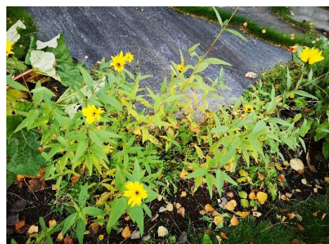
Figur 12 14. oktober er det framleis blomar i hagen