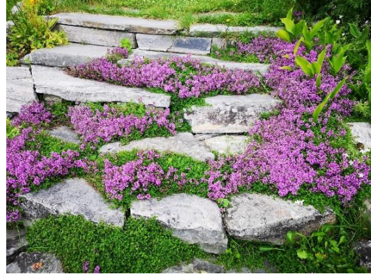
Figur 8 Kryptimian pyntar opp steintrappa