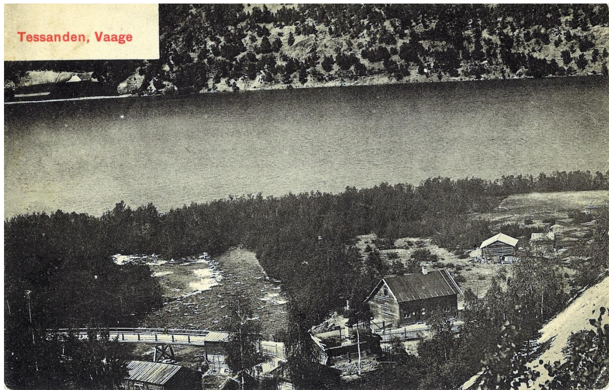
Tessanden 1908-1909.