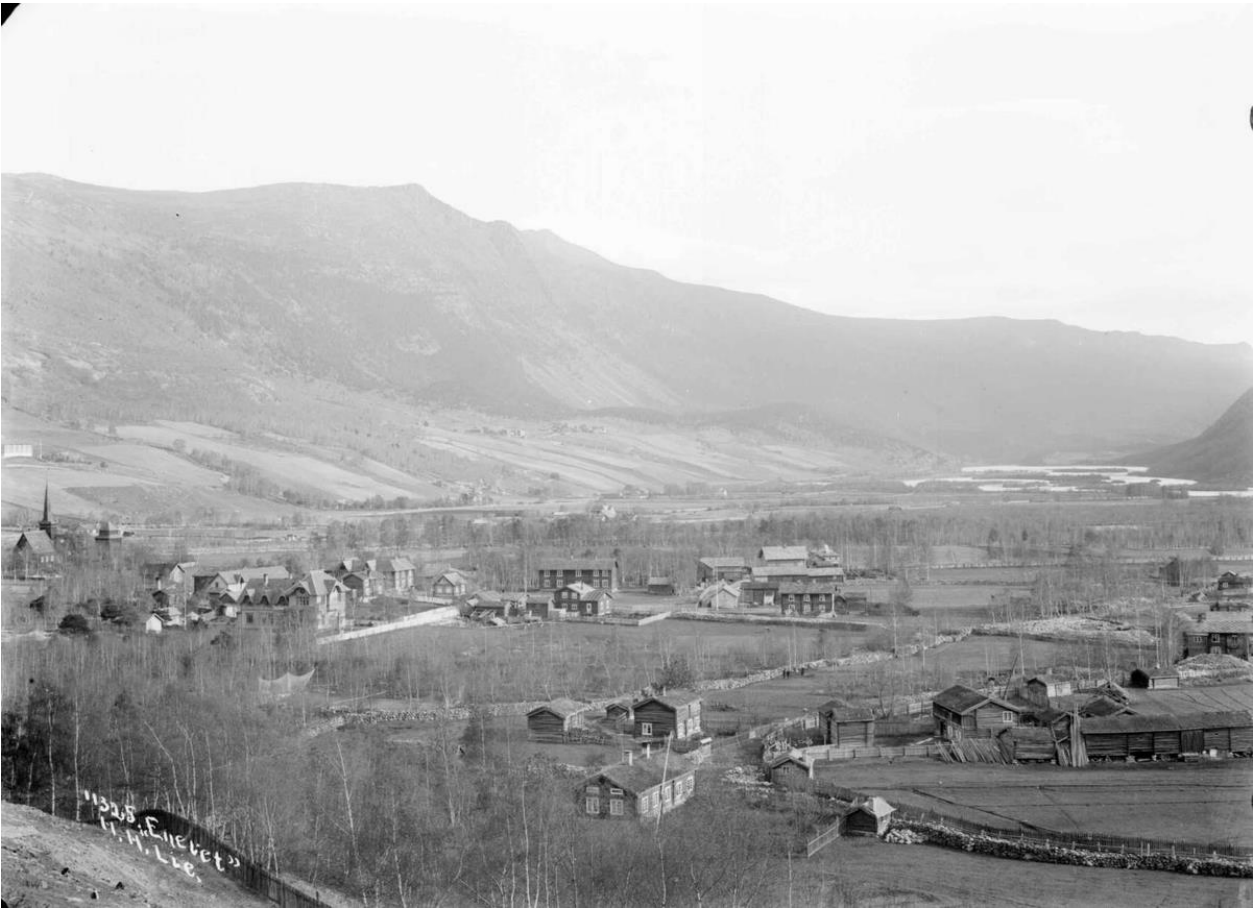
Vågåmo ca. 1908, nördre Grindstugu og Vistemo fremst midt på bildet, Kjøpanger til høyre.