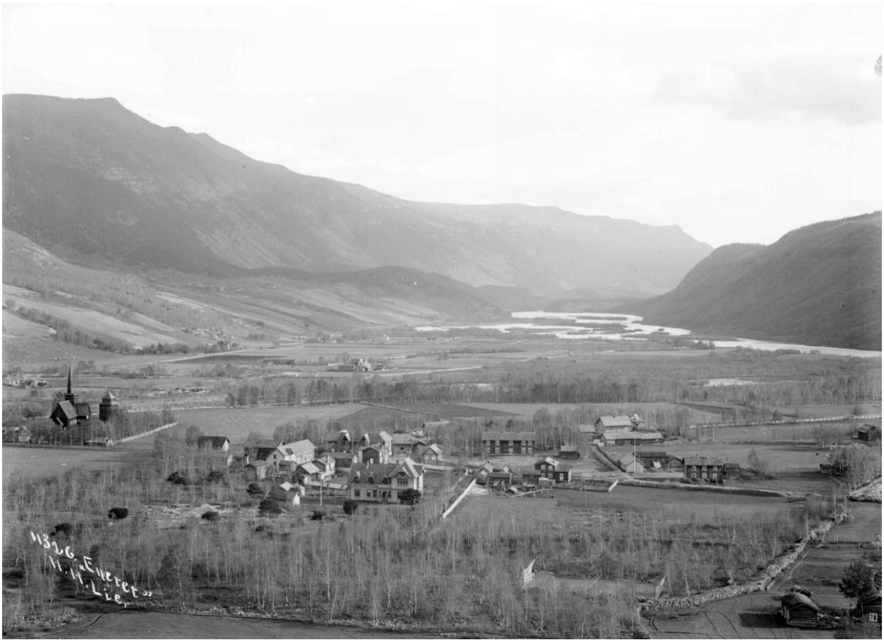
Vågåmo ca. 1908, banken fremst i bildet.

Opplandsarkivet Vågå: familieark, folketeljingar, avskrifter pantebøker mm.