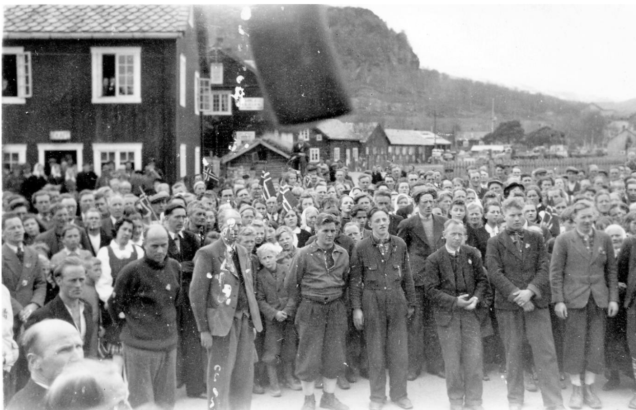
Veistad og Kirkenær, i bakgrunnen Bruland og OKB-verkstaden.

Digitalarkivet: kyrkjebøker, folketeljingar