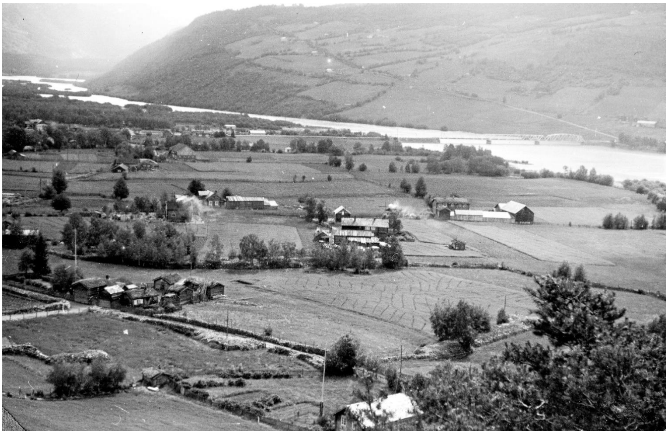
Nermoein med Haug, Haugamoen, Slettmo og Fagernes.